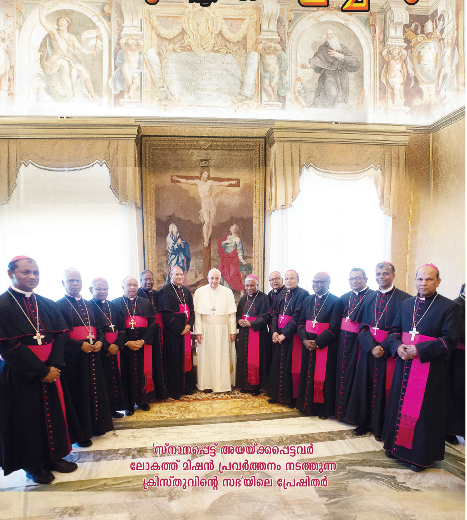
'സ്നാനപ്പെട്ട് അയക്കപ്പെട്ടവർ ലോകത്ത് മിഷൻ പ്രവർത്തനം നടത്തുന്ന ക്രിസ്തുവിന്റെ സഭ'യിലെ പ്രേഷിതർ