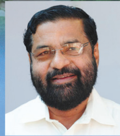
Sri. Kadakompalli Surendran Hon. Minister of Kerala