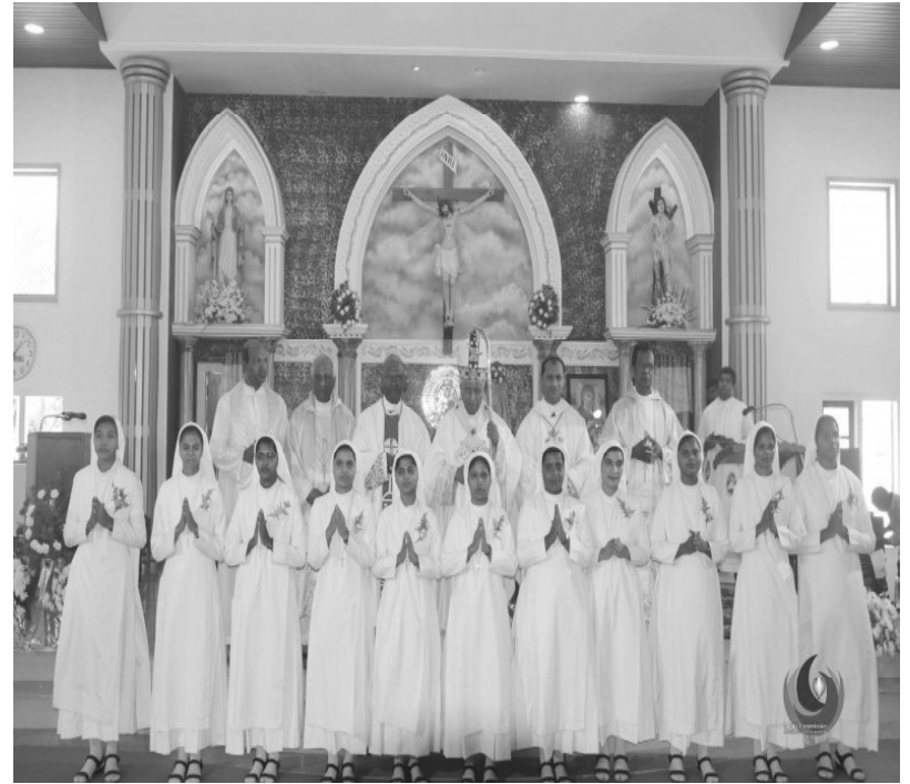
അതിരൂപത അഡ്യക്ഷൻ പ്രത്യക്ഷയുടെ ദാസിമാർക്ക് സഭാവസ്ത്രം നൽകി സഭയിലേക്ക് സ്വീകരിച്ചു