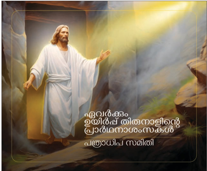
ഏവർക്കും ഉയിർപ്പ് തിരുനാളിന്റെ പ്രാർഥനാശംസകൾ പത്രാധിപ സമിതി

മാർച്ച് ലക്കത്തിലെ മുഖവിചാരം ഹൃദ്യമായിരുന്നു. തപസ്സുകാലത്തെ ധന്യമാക്കുവാൻ വേണ്ടതെല്ലാം മുഖവിചാരം തന്നെ. ആത്മീയ ജീവിതത്തിന്റെ വ്യത്യസ്ത അർഥതലങ്ങൾ അന്യരെയും ചേർത്തണയ്ക്കുമ്പോൾ മാത്രമേ പൂർണ്ണമാവുകയുള്ളൂ. അതാണ് ക്രൈസ്തവ ആധ്യാത്മികതേജസ്സിന്റെ പൊരുളും ഉൾപ്പെടാത്ത ഉൾപ്പളകവും. സ്നേഹത്തിന് പുത്തൻ ദാർശനിക മാനങ്ങൾ പകർന്നു തരാൻ നസ്രായന് കഴിഞ്ഞു. പാദം കഴുകി ചുംബിച്ച ക്രിസ്തുവിന്റെ പാദം പിന്തുടരാനുള്ള അനുഗൃഹീതമായ നോമ്പുകാലത്തെക്കുറിച്ചുള്ള അത്യുത്തമ 'മുഖവിചാര'ത്തിന് നന്ദി. പ്രത്യാശ നിറഞ്ഞ ഈസ്റ്ററാശംസകൾ നേരുന്നു.