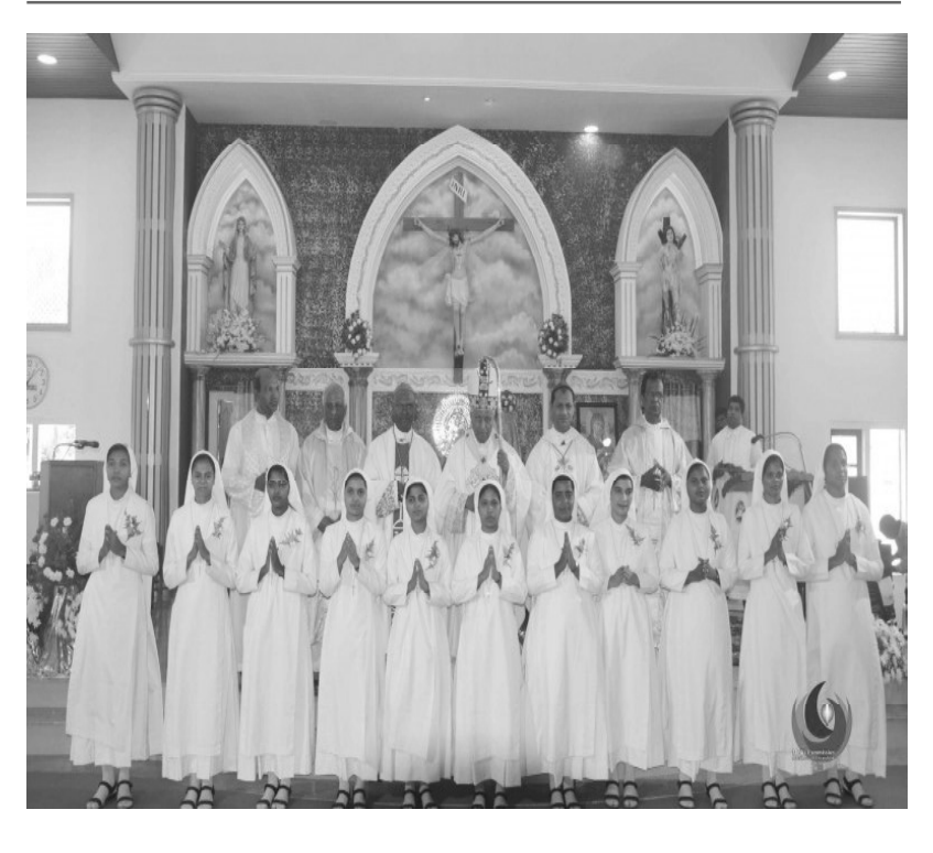
അതിരൂപത അദ്ധ്യക്ഷൻ പ്രത്യാശയുടെ ദാസിമാർക്ക് സഭാവസ്ത്രം നല്കി സഭയിലേക്ക് സ്വീകരിച്ചു